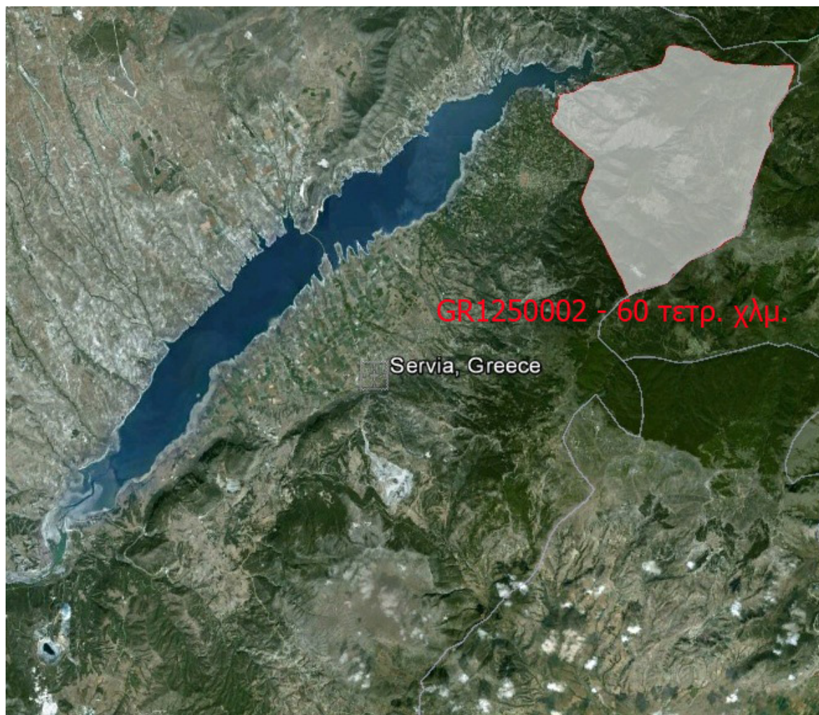
ΧΑΡΤΗΣ 1: ΠΕΡΙΟΧΗ NATURA – 2000 (ΚΩΔ. GR1250002).

η πρώτη πόλη της Μακεδονίας η οποία απελευθερώθηκε μετά τη μάχη του Σαρανταπόρου κατά τον 1 ο Βαλκανικό πόλεμο (9-10 Οκτωβρίου 1912), ανοίγοντας το δρόμο για την απελευθέρωση της Θεσσαλονίκης (26 Οκτωβρίου 1912) και της υπόλοιπης Μακεδονίας.